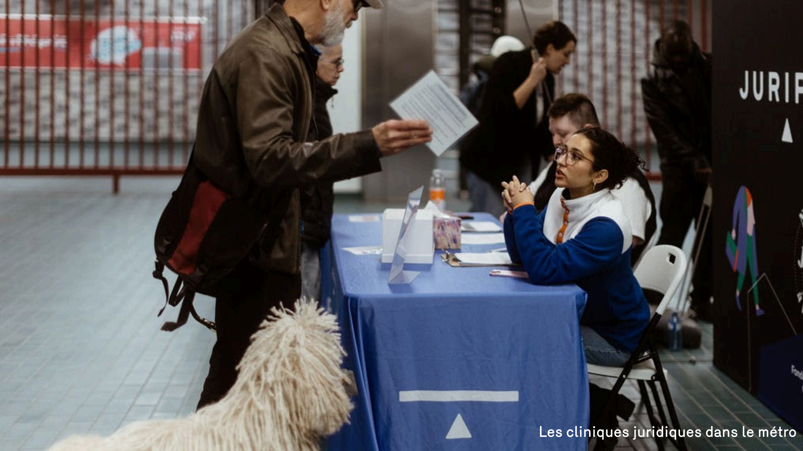
Les cliniques juridiques dans le métro